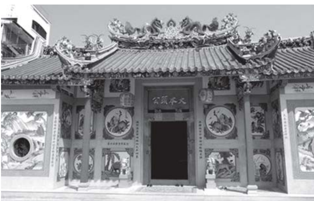
ภาพที่ 2 ศาลเจ้าเล่าปุ่นเต่ากง