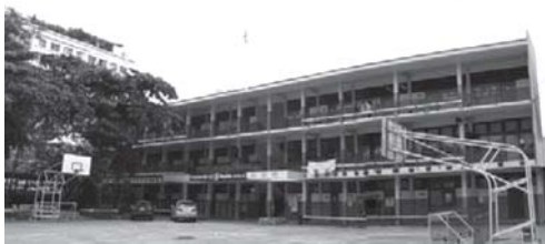
ภาพที่ 12 โรงเรียนยุพินพัฒนา

สถาปัตยกรรมรูปแบบสากลแบบเรียบ เป็นรูปทรงกล่องที่พบเห็นได้ทั่วไปไม่มีโดดเด่นพิเศษแต่อย่างใด ความสะดวกสบายและประหยัด ชายคาของอาคารเป็นคอนกรีตยื่นเหนือช่องทางเดินทุกชั้น ด้านหน้ามีระเบียงทางเดินทั้งชั้นล่างและชั้นบน มีราวกันตกเป็นลูกกรงเหล็ก ลักษณะช่องเปิดเป็นรูปแบบเดียวกันที่เรียงต่อซ้ำ ๆ กัน บันไดอยู่ภายนอกอาคาร เน้นความสมมาตรด้วยตำแหน่งบันไดที่กึ่งกลางอาคาร หรืออาจอยู่บริเวณปีกทั้งสองของอาคารก็ได้ ใช้แผงกันแดดคอนกรีตในระนาบตั้งและระนาบนอนในการป้องกันแสงแดดสำหรับอาคารหลังคามีทั้งที่เรียบแบบลาดฟ้าและแบบจั่วไม่ยื่นชายคา (ภาพที่ 12)