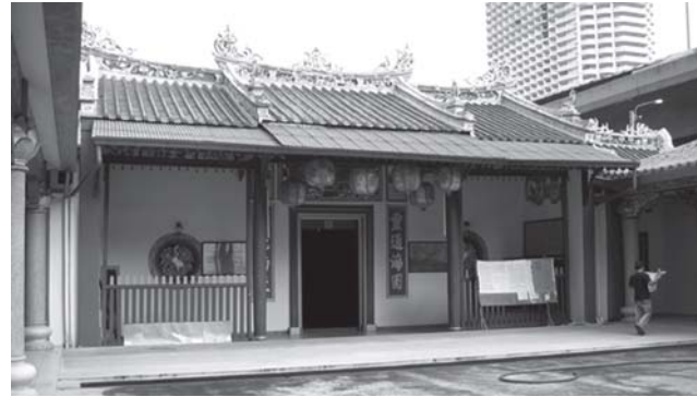
ภาพที่ 4 ศาลเจ้าเจิวเจ็งเบี้ยว