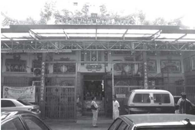
ภาพที่ 1 ศาลเจ้าโจวช็องก้ง

สถาปัตยกรรมรูปแบบจีนประเพณีที่ปรากฏในประเทศไทยรวมถึงกรุงเทพมหานครในช่วงเวลานี้ ส่วนใหญ่เป็นอาคารศาสนสถานประเภทศาลเจ้า โดยมีลักษณะรูปแบบสถาปัตยกรรมจีนประเพณีดังที่กล่าวมา (ภาพที่ 1 - 5)