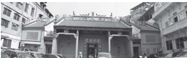
ภาพที่ 3 ศาลเจ้าก้งจิ้นถ้ง