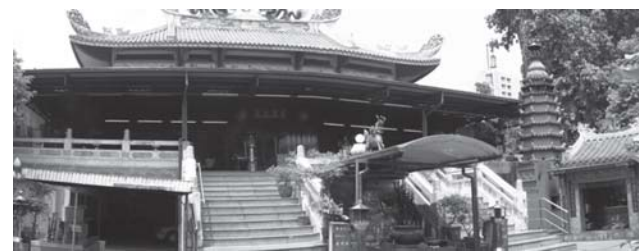
ภาพที่ 5 ศาลเจ้าหลี่ตี้เบี้ยว

3.2 พ.ศ. 2457 - 2488 ยุคแห่งการปรับตัวสู่ความสมัยใหม่แบบตะวันตก (การออกพระราชบัญญัติสมาคมในต้นรัชกาลที่ 6 - การสิ้นสุดของสงครามโลกครั้งที่ 2 ในสมัยปลายรัชกาลที่ 8) ในช่วงเวลานี้เป็นช่วงที่สังคมไทยมีการรับวัฒนธรรมจากชาติตะวันตก เพื่อปรับปรุงประเทศให้ก้าวเข้าสู่ความทันสมัย สถาปัตยกรรมที่สร้างขึ้นในช่วงนี้จึงมีลักษณะของการผสมผสานศิลปกรรมตะวันตกเข้าไป ซึ่งปรากฏทั้งในสถาปัตยกรรมของไทยและของชาวจีน ทำให้ชาวจีนกลุ่มต่าง ๆ เร่งพัฒนากิจกรรมทางสังคมของกลุ่มภาษาตนให้สามารถตอบรับกับความเปลี่ยนแปลงของสังคมโดยรวมได้ กิจกรรมของชาวจีนที่เกิดขึ้นในยุคนี้จึงเป็นกิจกรรมที่สร้างขึ้นเพื่อให้ชาวจีนสามารถพึ่งพาตนเองได้ เช่น โรงเรียน สมาคม และโรงพยาบาล ลักษณะทางกายภาพของงานสถาปัตยกรรมของชาวจีนมีกลิ่นไอของความเป็นตะวันตกผสมอยู่ ที่ทำให้นักย้อนไปในปลายคริสต์ศตวรรษที่ 19 (พีรศรี โปวาทอง, 2548, น. 5) ซึ่งเป็นยุคนิยมสถาปัตยกรรมแบบคลาสสิกหรือยุคฟื้นฟูศิลปะแบบกรีกและโรมัน (มุสดี ทิพทัส, 2541, น. 11) เรียกว่า รูปแบบอิตาเลียนเรเนซองส์ และรูปแบบอทธิพลตะวันตก แต่ยังคงไว้ซึ่งการสื่อความหมายมงคล ตามความเชื่อชาวจีนเช่นเดิมโดยใช้ภาพสัญลักษณ์พืช ดอกไม้ และสัตว์ เช่น ดอกเบญจมาศ ดอก