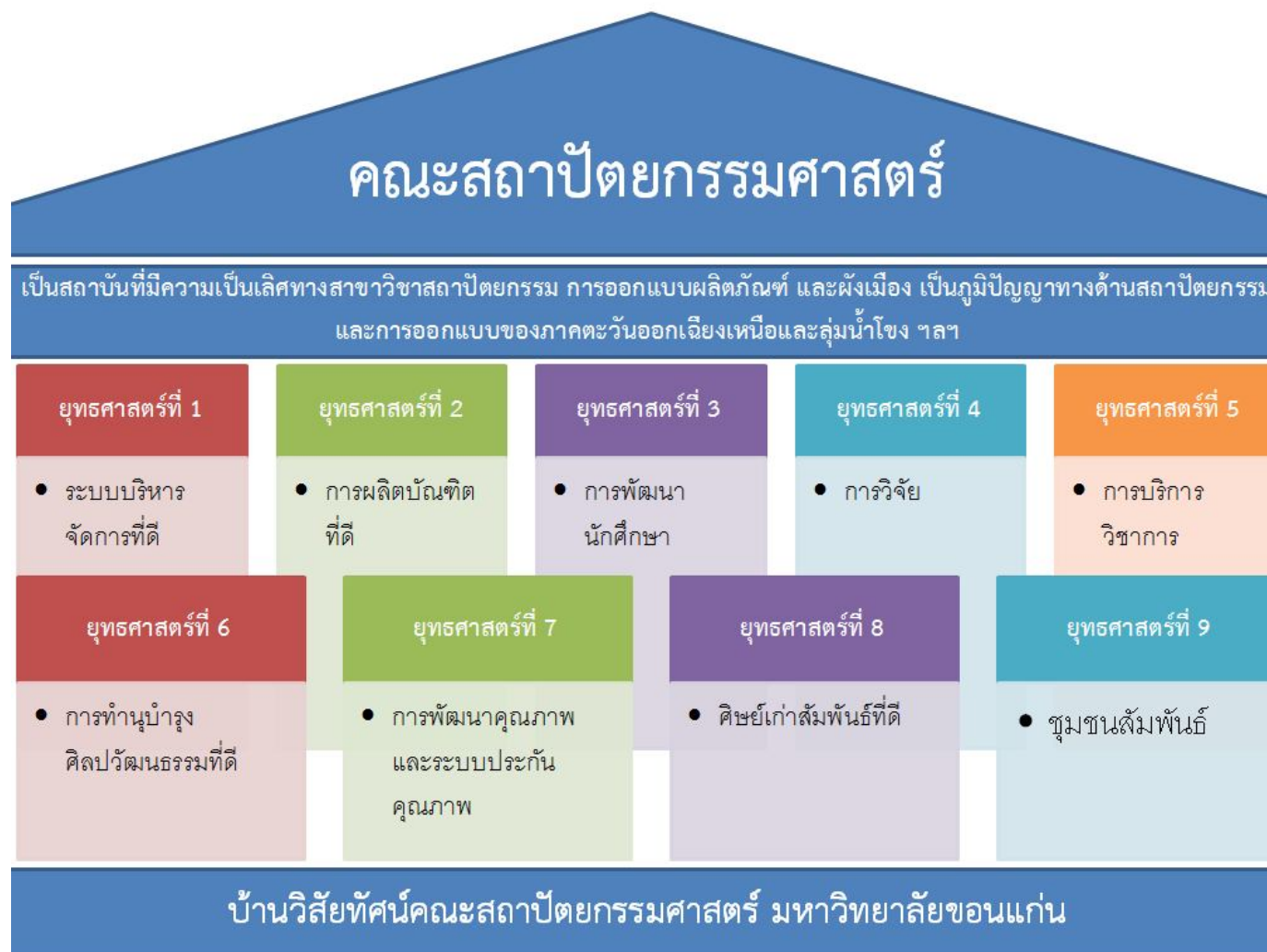
รูปที่ 1 แผนที่ยุทธศาสตร์คณะสถาปัตยกรรมศาสตร์